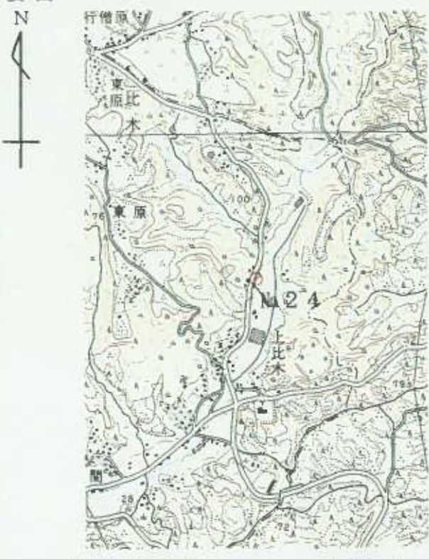
1/25,000 御 前 崎