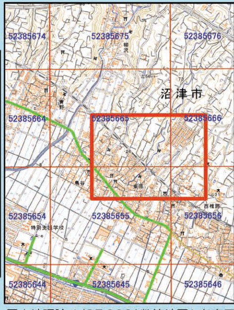
国土院 1/25,000 (数値地図) を表示