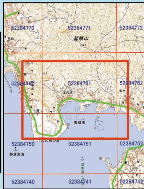
国土地理院 1/25,000(数値地図)を表示