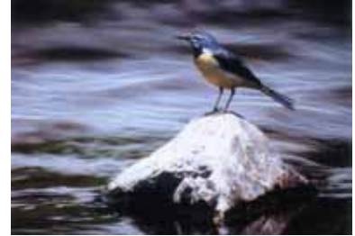
市の鳥「キセキレイ」

市の将来像「みどり 次世代」にもっともふさわしい木として、また菊川市が緑豊かな市に発展するようにとの願いが込められています。