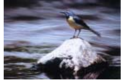
市の鳥「キセキレイ」

市の将来像「みどり 次世代」にもっともふさわしい木として、また菊川市が緑豊かな市に発展するようにとの願いが込められています。