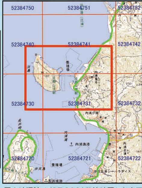
国土地理院 1/25,000(数値地図)を表示