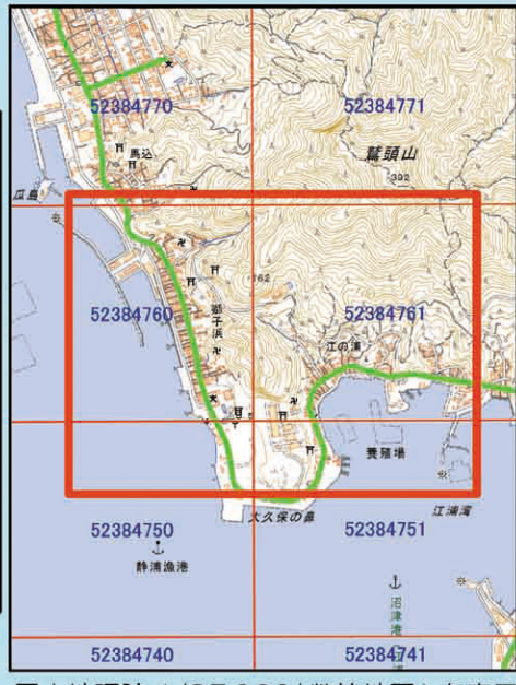
国土地理院 1/25,000(数値地図)を表示