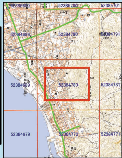
国土地理院 1/25,000(数値地図)を表示